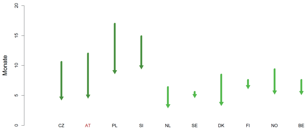
Abbildung 1: Verkürzung der Transitionszeit von Bildung in Beschäftigung durch einen ISCED 3-Abschluss in Monaten

Quelle: EUROSTAT, LFS adhoc 2009; Moser und Lindinger 2014. 5